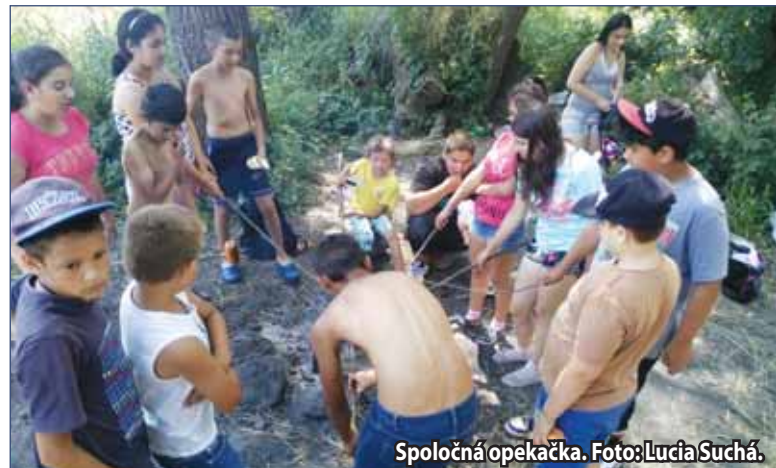
Spoločná opekačka.

Komunitné centrum v Žiari nad Hronom má v súčasnosti piatich komunitných pracovníkov, ktorí majú kanceláriu na Ul. M. Chrástka, v budove tzv. Jadranov. Na zriadenie Komunitného centra získalo mesto Žiar nad Hronom finančné prostriedky z Národného projektu Komunitné centrum, ktorý potrvá od februára do novembra 2015. Prevádzkovateľom Komunitného centra je mesto Žiar nad Hronom. Hlavným cieľom národného projektu je podpora sociálnej inklúzie a pozitívnych zmien v komunite s dôrazom na marginalizovanú rómsku komunitu prostredníctvom rozvoja komunitnej práce v tomto centre. (II)