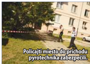
Policajti miesto do príchodu pyrotechnika zabezpečili.

Zaujímavosťou je, že muníciu mali Žiarčania dlhé roky priamo pod svojimi oknami a ani pri rôznych výkopových prácach na ňu nikto netrafil. Aktivační pracovníci ju pritom pri kopaní našli v hĺbke asi iba 30 – 40 centimetrov. (li)