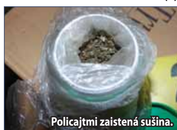
Policajti zaistená sušina.

ústavu PZ, v prípade zaistenej sušiny by bolo možné vyrobiť 255 až 725 obvykle jednorazových dávok drogy. „V prípade zelených rastlín v čerstvom nevysušenom stave sa bude dať počet dávok vyčísliť až po ich vysušení. Predbežne možno konštatovať, že pôjde rádomo o desiatky obvykle jednorazových dávok drogy. Po vykonaní procesných úkonov vyšetrotateľ obvineného umiestnil do policajnej cely a spracoval podnet na jeho vzatie do väzby,“ dodala Faltániová. Za tento zločin hrozí trest odňatia slobody na 3 až 10 rokov. (li)