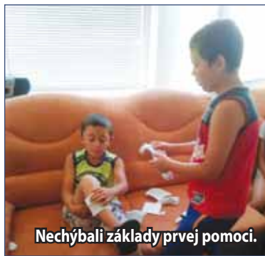
Nechýbali základy prvej pomoci.

Aktivity prímestského tábora sa každý deň menili, striedali a neboli ani na rovnakom mieste. Napríklad opekačku mali deti pri Lutiskom potoku a ďalší deň už venčili psíkov z útulku. Na jednej strane im deti pomohli a venovali pozornosť a na druhej strane im komunitní pracovníci vysvetlili, že ako sa majú starať o zvieratká a ako sa k nim správať. Pracovníci komunitného centra sa jeden týždeň z prímestského tábora zamerali