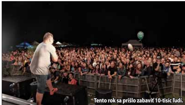
Tento rok sa prišlo zabaviť 10-tisíc ľudí.