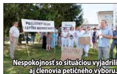
Nespokojnosť so situáciou vyjadrili aj členovia petičného výboru.