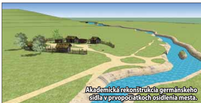
Akademická rekonštrukcia germánskeho sídla v prvopôčiach osídlenia mesta.

Pri vykopávkach v 80-tych rokoch minulého storočia, na ktorých som sa zúčastnil aj ja, sa odkryli urny s popolom, v ktorých boli uložené milodary z bronzu. V tom období vzácného kovu, z ktorého si časť obyvateľstva, tá bohatá, dávala vyrábať šperky a ukladala si ich do hrobov. Áno, bolo aj veľa chudobných hrobov, niektoré tvorili len jamku vyhlbenú do zeme a v nej popol, bez milodarov. Vyskytli sa aj takzvané kenotafi. Boli to symbolické hroby, ktoré patrili niekomu, kto