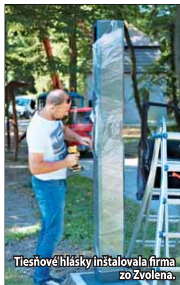
Tiesňové hlásky inštalovala firma zo Zvolena.

Na vybudovanie tiesňových hlások získalo mesto dotáciu z Úradu vlády SR pre prevenciu kriminality a inej protispoločenskej činnosti vo výške 34-tisíc eur. Projekt spolufinancuje aj mesto Žiar nad Hronom, a to vo výške 20 percent z obstarávacej hodnoty diela.