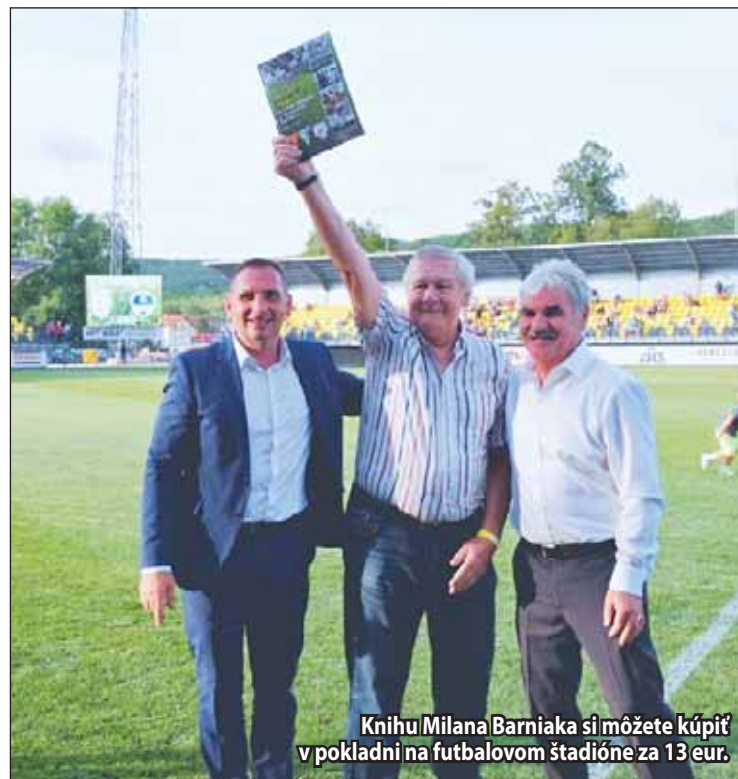
Knihu Milana Barniaka si môžete kúpiť v pokladni na futbalovom štadióne za 13 eur.