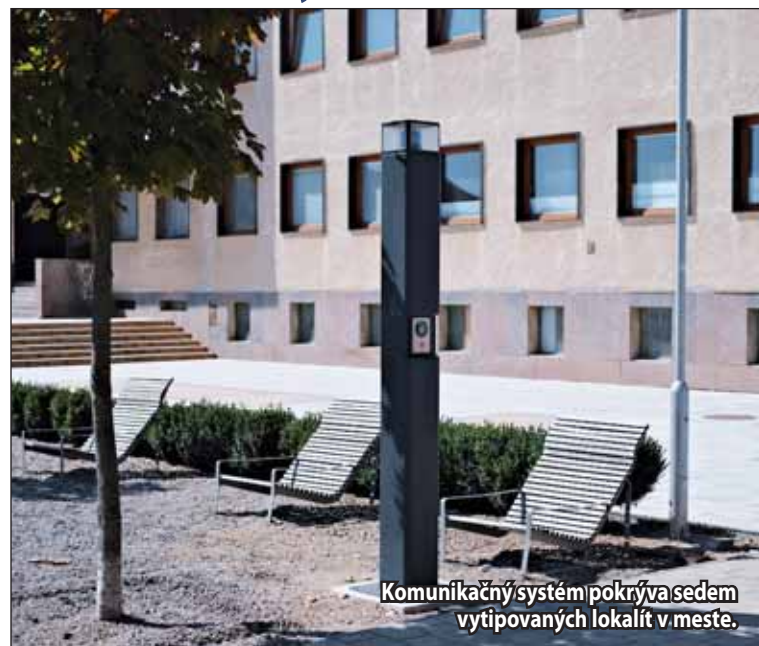
Komunikačný systém pokrýva sedem vytipovaných lokalít v meste.