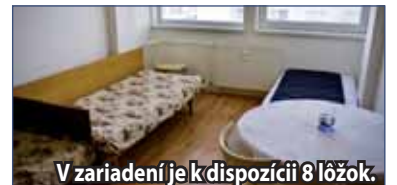
V zariadení je k dispozícii 8 lôžok.