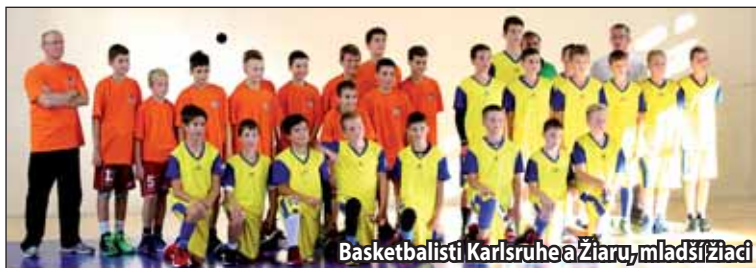
Basketbalisti Karlsruhe a Žiaru, mladší žiaci.

Krahulec. Úradujúci vicemajstri Slovenska, mladší žiaci BK MŠK Žiar nad Hronom, majú za sebou len hrubú kondičnú prípravu. Napriek tomu nastúpili do zápasu koncentrovane a s veľkým nasadením. Hrali agresívne v obrane, presne a rýchlo