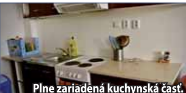
Plne zariadená kuchynská časť.