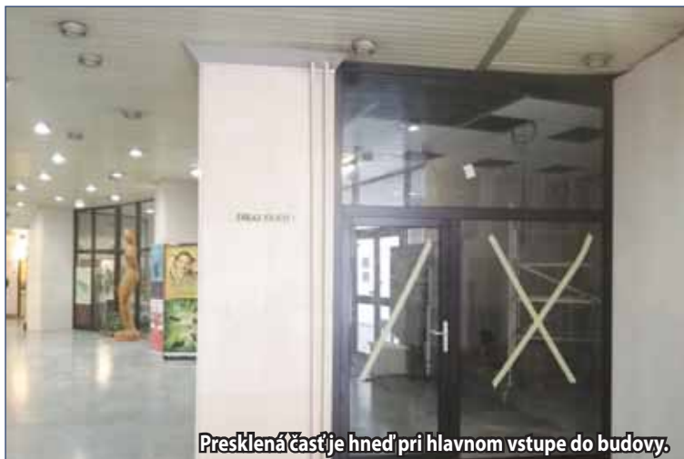
Presklená časť je hneď pri hlavnom vstupe do budovy.