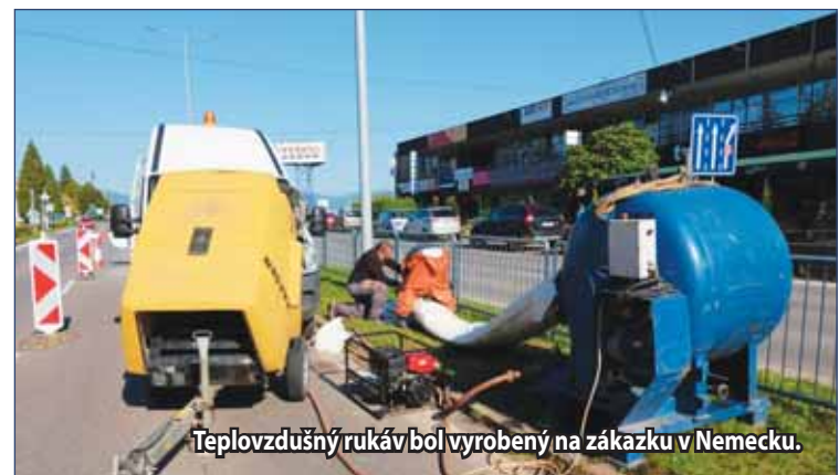
Teplovzdušný rukáv bol vyrobený na zákazku v Nemecku.