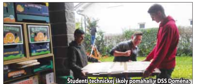
Študenti technickej školy pomáhali v DSS Doména.

„V utorok sa pod záštitou Súkromnej strednej odbornej školy pedagogickej EBG realizovala aktivita pomocná ruka havkáčom. Študenti za financie, ktoré vyzbierali počas zbierky, nakúpili pre psy potravu aj potrebnú drogeriu. Súčasťou tejto dobrovoľníckej aktivity bolo aj venčenie psíkov v útulku. OZ ZaŽiar v spolupráci s Mestským mládežníckym parlamentom zabezpečil