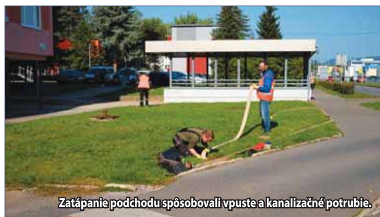
Zatekanie podchodu spôsobovali vpuste a kanalizačné potrubie.