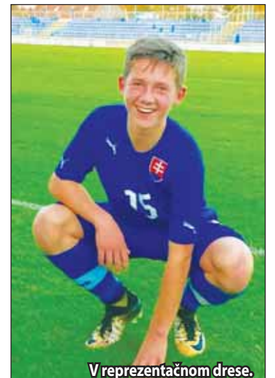
V reprezentačnom drese.