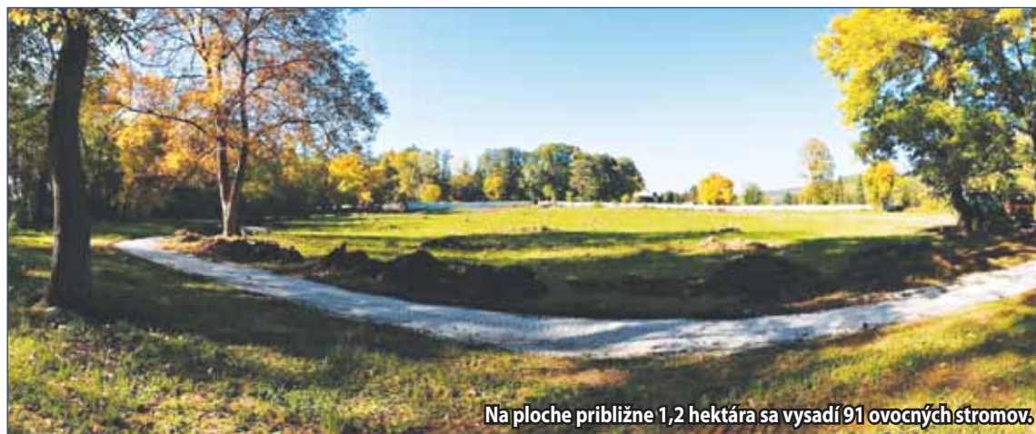
Na ploche približne 1,2 hektára sa vysadí 91 ovocných stromov.

V týchto dňoch sa v sade robia aj zemné práce, aktuálne sú to chodníky okolo celého areálu. „Atraktivitu sadu zvýšia prírodné lavičky z agátového dreva, sieť chodníkov, kvitnúce pásy bylín a miesta pre piknik. Sad tak bude slúžiť aj na oddych, na šport a v neposlednom rade aj na edukáciu v rámci škôl, kedy chceme v budúcnosti