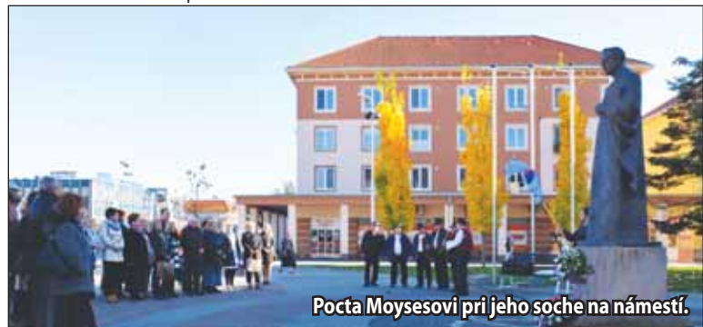
Pocťu Moysesovi pri jeho soche na námestí.