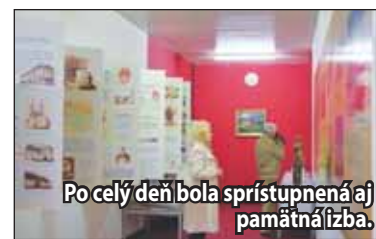
Po celý deň bola sprístupnená aj pamätná izba.

keď v našom meste Moyses pôsobil, nechýbajú ani predmety, ktoré prvý predseda Matice slovenskej používal či jeho odev. Väčšinu z vystavovaných predmetov zapožičali do pamätnej izby Biskupský úrad v Banskej Bystrici a Matica slovenská. Medzi najzaujímavejšie patria postriebrená cukornička so soľničkou, štóla, biskupské rukavice, ornát alebo mitra. (II)