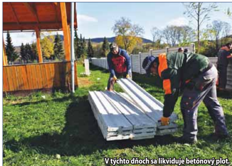
V týchto dňoch sa likviduje betónový plot.