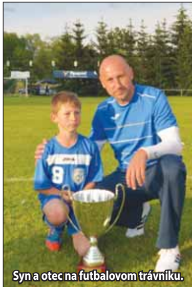
Syn a otec na futbalovom trávniku.