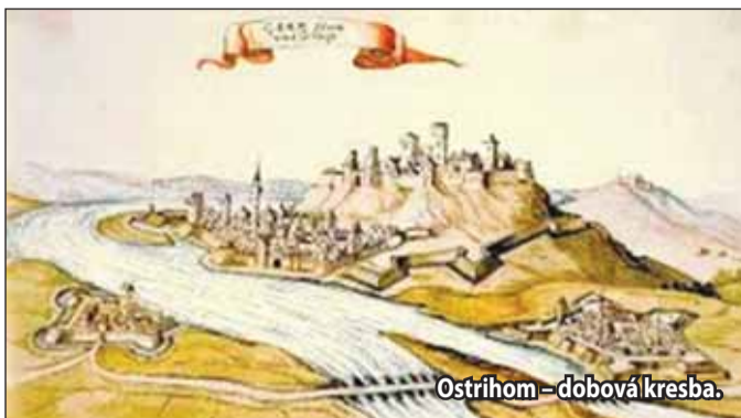
Ostrihom – dobová kresba.

A aj z tohto dôvodu udeľuje mestské práva tejto osade, čím ju pozdvihuje na vyššiu hospodársku, správnu a politickú úroveň. Veď mestské výsady boli udelené v čase utvárania sa miest v návaznosti na rozvoj územia kráľovstva. Je pre nás nanajvýš zaujímavé a lichoťivé, že patríme medzi mestá s najstaršími mestskými