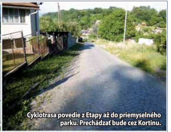
Cyklotrasa povedie z Etapy až do priemyselného parku. Prechádzať bude cez Kortinu.