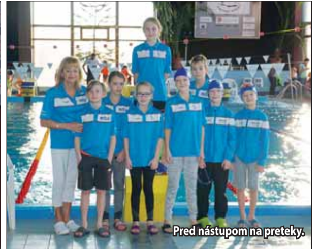
Pred nástupom na preteky.