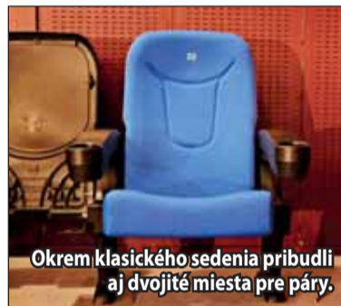
Okrem klasického sedenia pribudli aj dvojité miesta pre páry.