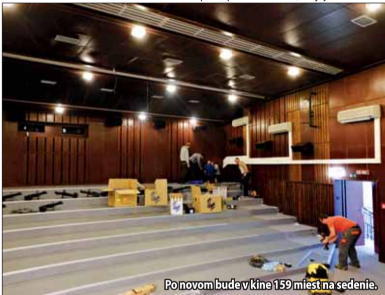
Po novom bude v kine 159 miest na sedenie.

Modernizáciu Kina Hron finančne podporil Audiovizuálny fond.