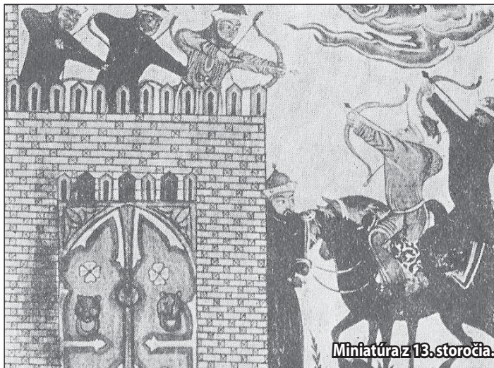
Miniatura z 13. storočia.

Pravdepodobne jeden z prúdov smeroval na kláštor v Hronskom Beňadiku. Či sa dostali vtedy až k osade Cruix ležiacej v katastri terajšieho Žiaru nad Hronom v jej časti dnešného starého mesta, nemáme priame dôkazy. Avšak je zaujímavé, že po odchode Mongolov sa Uhorsko dlho spamätávalo z následkov vpádu, niektoré miesta ani neboli obnovené