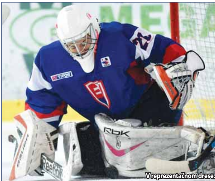
V reprezentačnom drese.