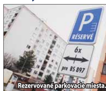
Rezervované parkovacie miesta.

Niekoľko nových parkovacích miest, ktorých výstavbu však bude realizovať samotné mesto, pribudne aj v tomto roku. Konkrétne ide o Svitavskú ulicu, kde sa bude rozširovať kapacita už existujúceho betónového parkoviska. Ide o osem parkovacích miest, čo je čiastočná náhrada za stavbu garáží na tomto parkovisku. Ak nebude záujem zo strany bytových spoločenstiev o vyhradené parkovacie miesta, tak