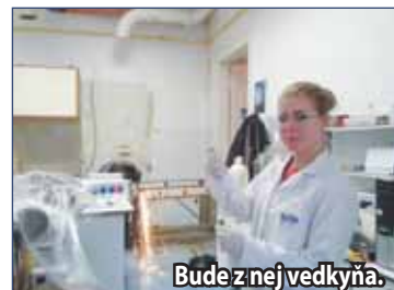
Bude z nej vedkyňa.