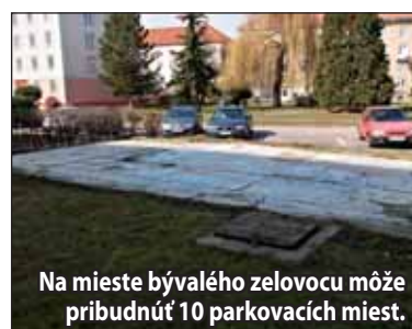
Na mieste bývalého zelovocu môže pribudnúť 10 parkovacích miest.