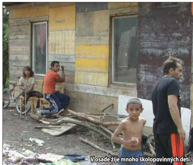
V osade žije mnoho školopovinných detí.

V Žiari nad Hronom funguje Terénna sociálna práca už sedem rokov. Od roku 2012 sa mesto zapojilo do