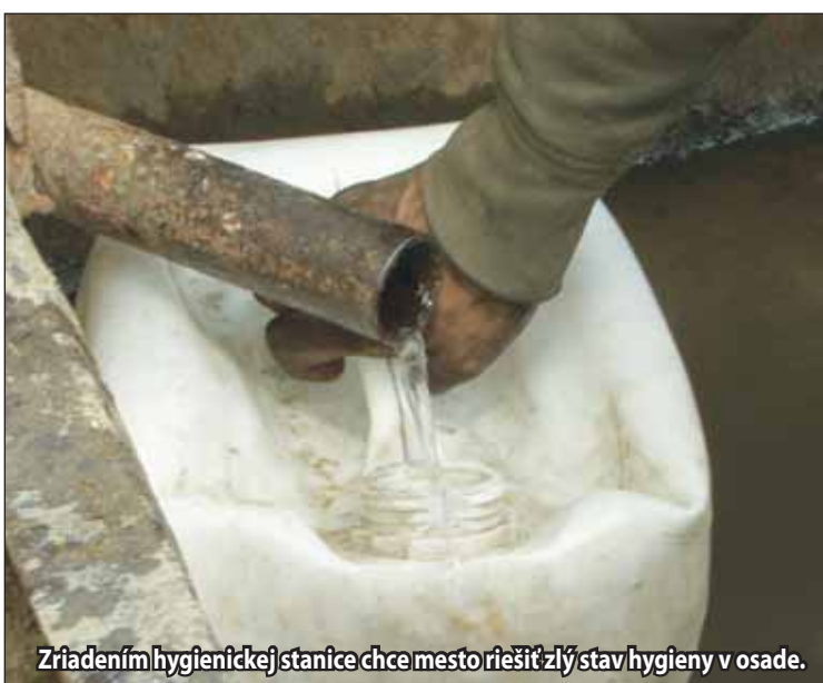
Zriadením hygienickej stanice chce mesto riešiť zlý stav hygieny v osade.