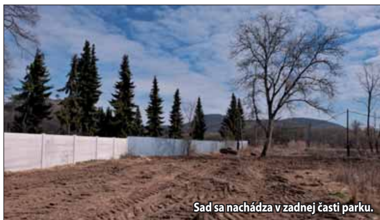
Sad sa nachádza v zadnej časti parku.