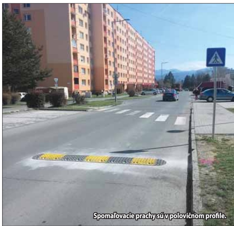
Spomaľovacie prahy sú v polovičnom profile.