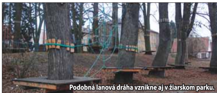
Podobná lanová dráha vznikne aj v žiarskom parku.

Súčasťou malého Rozprávkového lesa v Parku Štefana Moysesova je lanovková dráha pre deti, Perníková chalúpka, šmyklavka a hojdačky. V tomto roku by k týmto detským atrakciám mala pribudnúť aj lanová dráha.