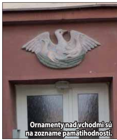
Ornamenty nad vchodmi sú na zozname pamätihodností.