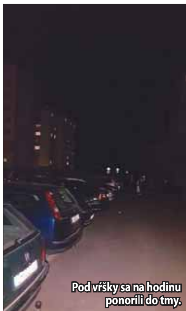
Pod vršky sa na hodinu ponorili do tmy.

História Hodiny Zeme sa datuje k 31. marcu 2007, kedy viac ako 2,2 milióna domácností a 2000 firiem v austrálskom Sydney vyplo na hodinu svoje osvetlenie. O rok neskôr sa do kampane zapojilo už 50 miliónov ľudí v 370 mestách a obciach vo výške 35 krajínach v 18 časových pásmach. (II)