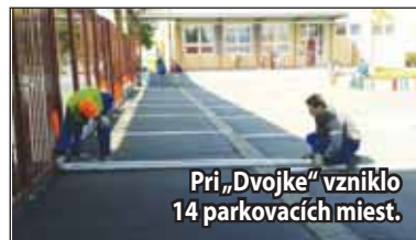
Pri „Dvojkách“ vzniklo 14 parkovacích miest.

„Dvojkou“ vyznačili 14 nových parkovacích miest. Využívať ich budú môcť zamestnanci školy, týmto spôsobom sa tak uvoľní parkovisko, ktoré slúži najmä rodičom žiakov. (II)