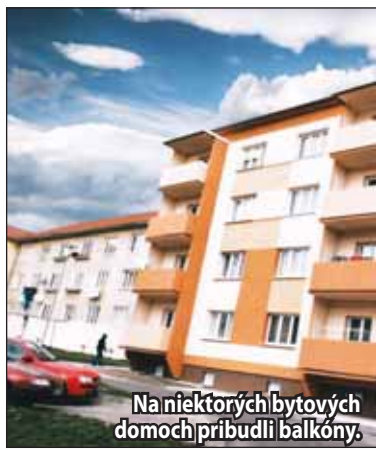
Na niektorých bytových domoch pribudli balkóny.