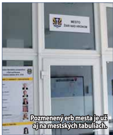
Pozmenený erb mesta je už aj na mestských tabuliach.

Žiarska kotlina, kedysi Šušolie, má i svoje trojvršie – Kremnické, Štiavnické, Vtáčnik.