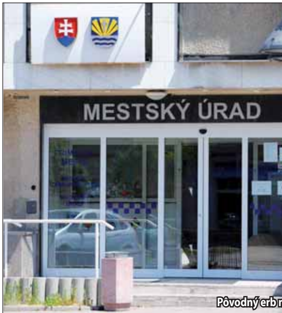
Pôvodný erb na budove MsÚ je už nahradený pozmeneným erbom (vpravo).

•Prvá vlna svojím tvarom pripomína trojvršie na štátnom znaku SR. Dokonca