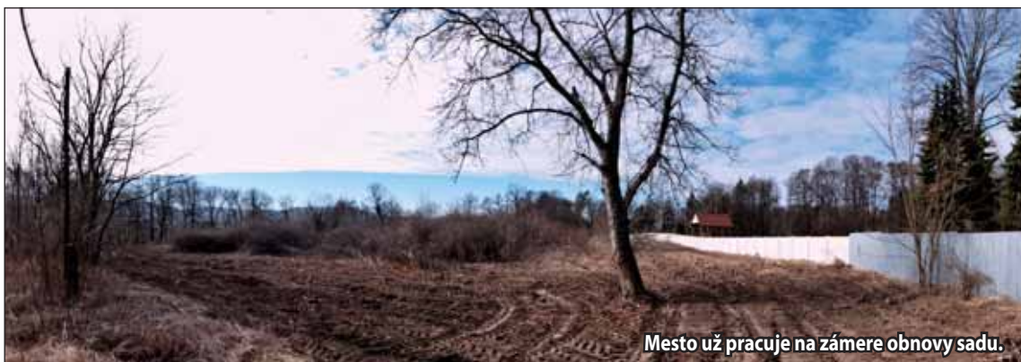
Mesto už pracuje na zámere obnovy sadu.